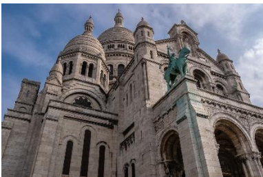
Le Sacré-Cœur de Montmartre